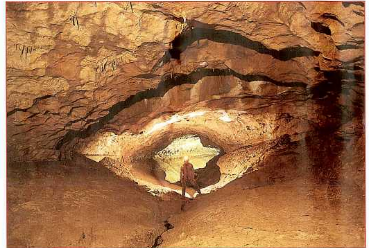
Boulevard des Tritons - DENT DE CROLLES - Isère - 1996

Festival de Spéléologie en Ile-de-France