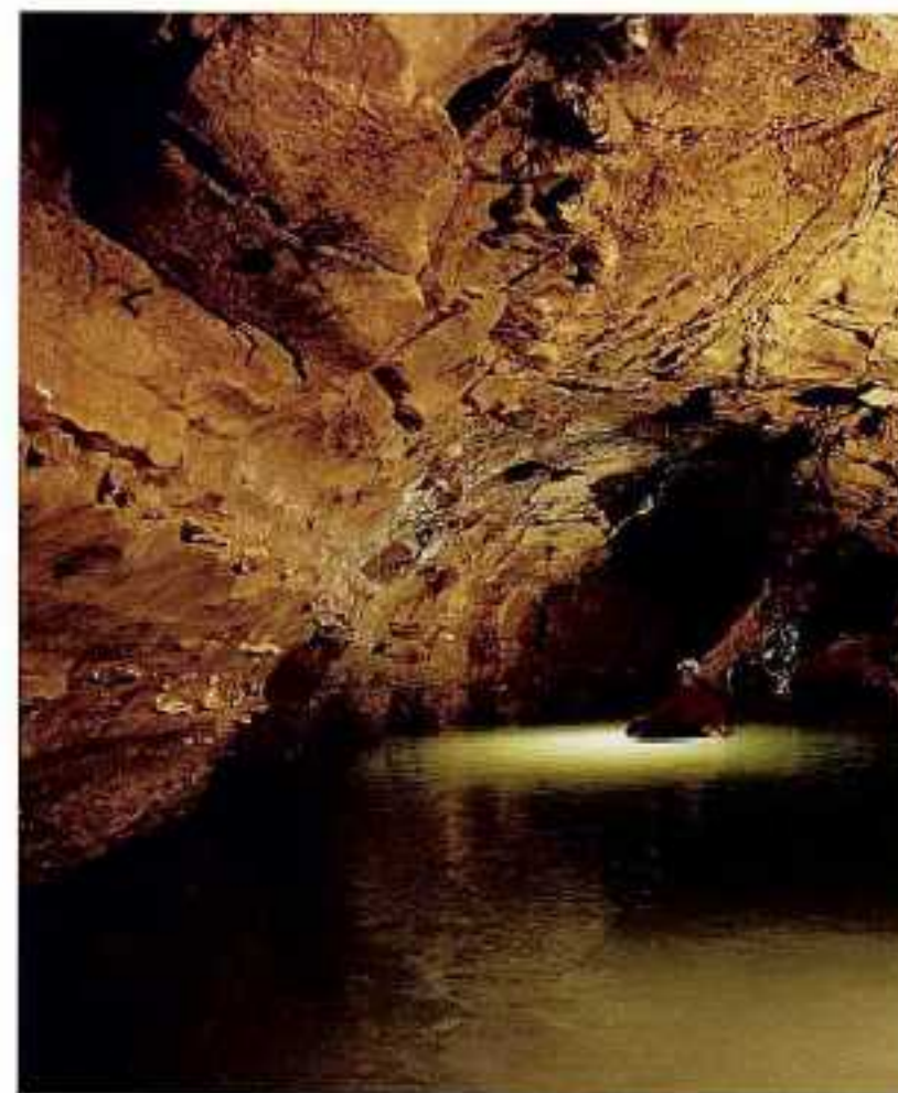
"Gouffre de la Combe aux Prêtres" • Daniel Chailoux • 1994